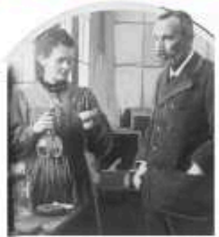
П'єр і Марія Кюрі